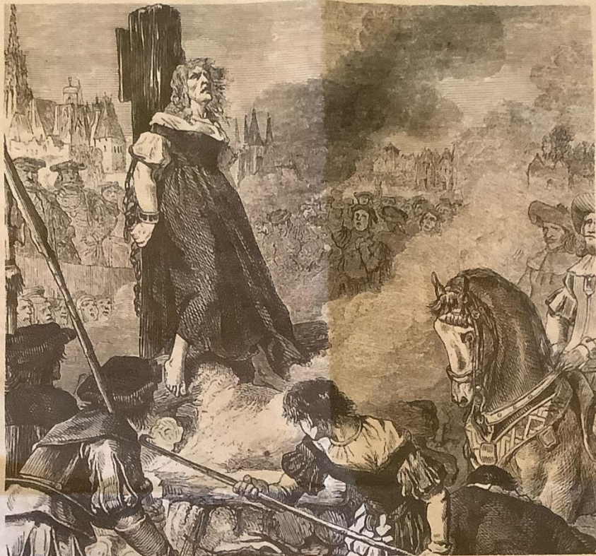
Heksenverbranding op de Grote Markt.